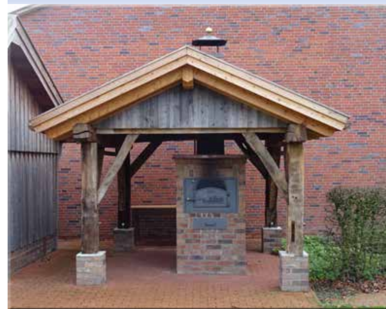
Der Holzbackofen des Heimatvereins Oeding e.V.