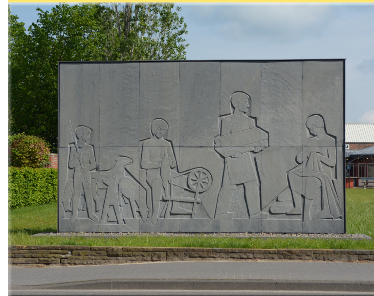
Relief der Firma Gebr. Schulten