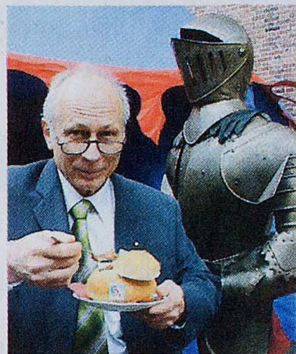
Oedinger Gulaschsuppe aus Südlohner Brottasse – Mahlzeit im Blick von Ritter Kunibert aus der Burg Oeding.