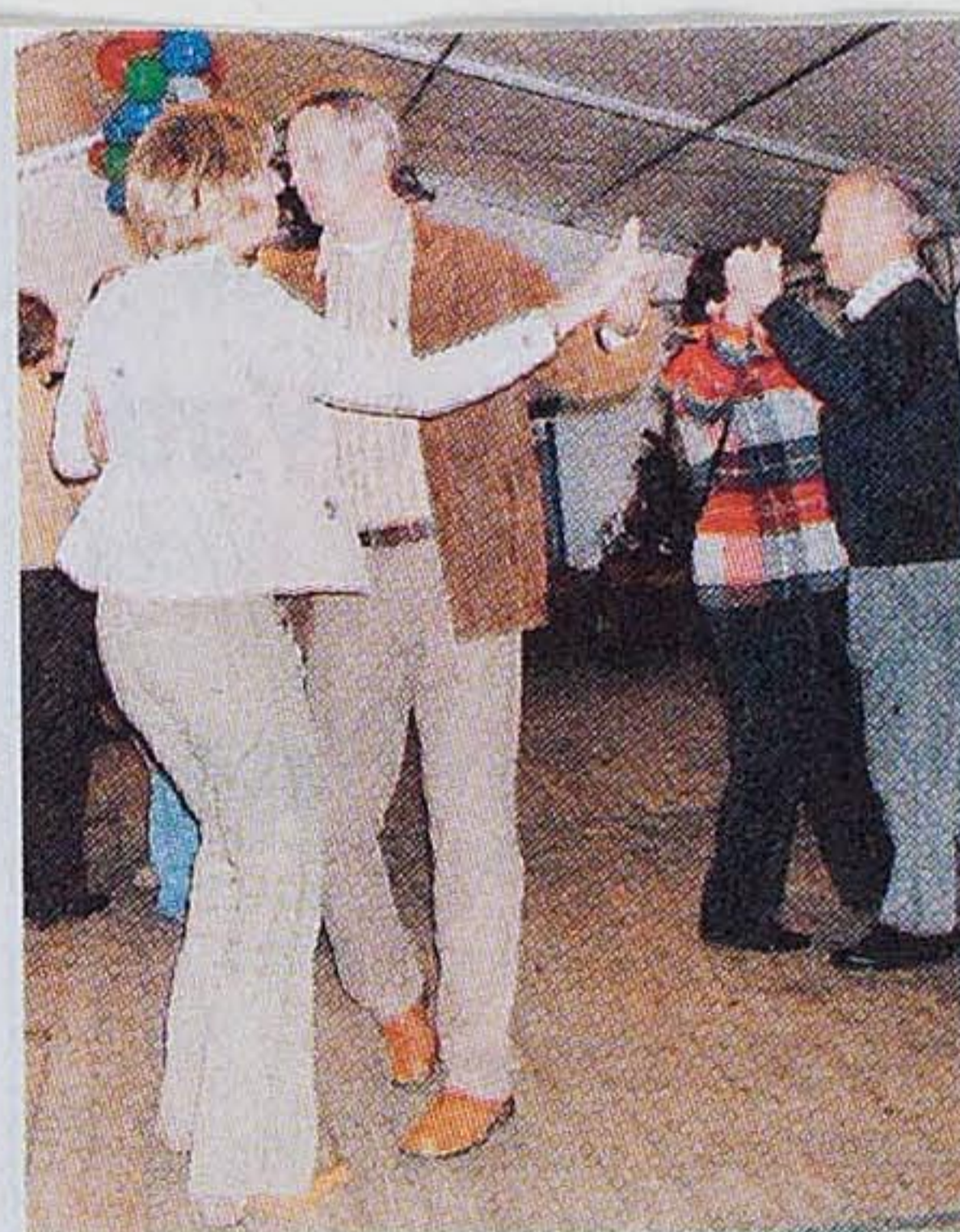
Ein Tänzchen in Ehren – wollte niemand verwehren...