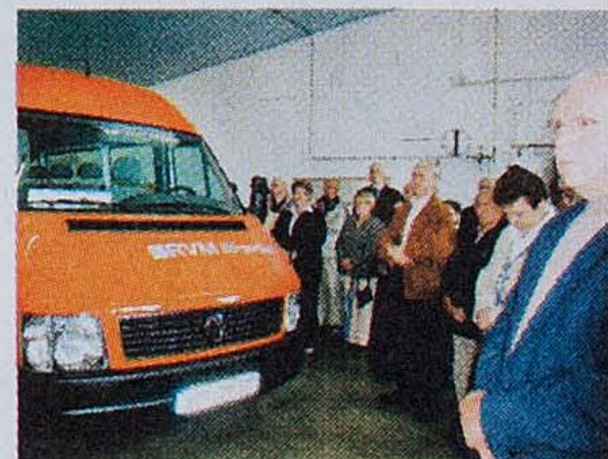
Segen für den Bürgerbus: Am Samstag wurde das Fahrzeug offiziell übergeben und eingeweiht. Ein ausführlicher Bericht folgt.