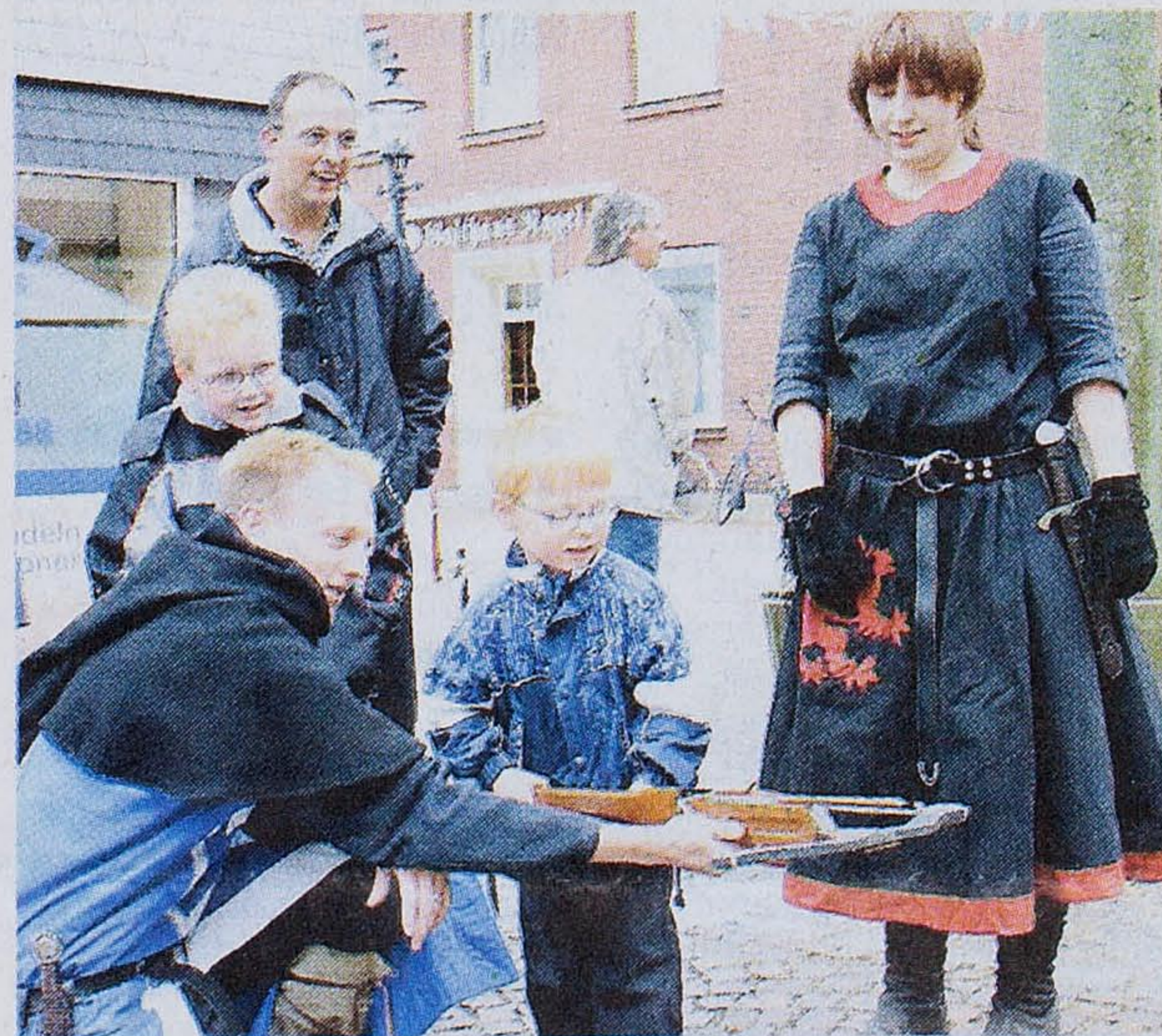
Einmal wie ein Ritter mit der Armbrust oder einem großen Bogen auf die Zielscheibe schießen – das machte großen Spaß.