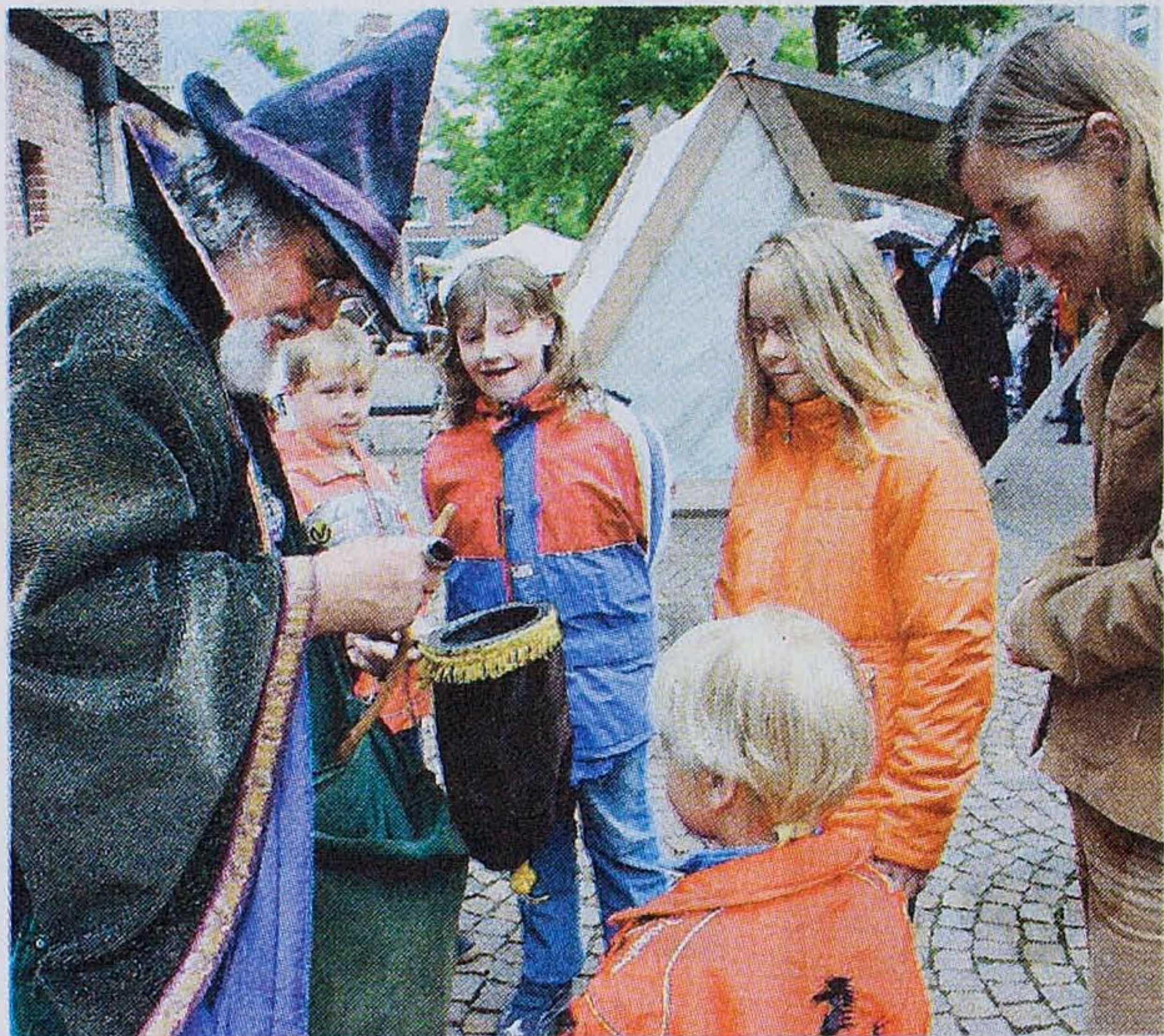
Der Zauberer kam bestens an: So manch kleiner Südlohner zauberte selbst die Knoten aus dem Seil.

Südlohn ■ Ihr 775-jähriges Bestehen feiern die Kirchengemeinde St. Vitus und die politische Gemeinde Südlohn mit einer Festwoche, die am Wochenende eingeläutet wurde. So wurden gestern, bevor alle Interessierten bei einem mittelalterlichen Markt in die Gründungszeit „Suthlons“ eintauchen konnten, drei Bäume auf der Verbindungsstraße der Ortsteile Südlohn und Oeding gepflanzt. Die Aktion wurde im Rahmen des „100-Alleen-Programms“ des Landes NRW durchgeführt. ■ ewa