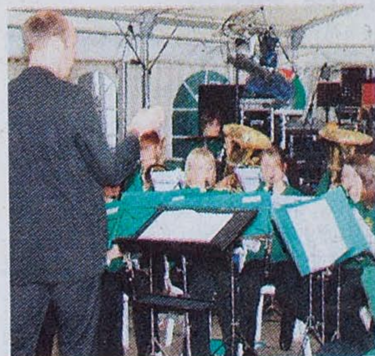
... bestimmt nicht der Musikkapellen-Nachwuchs.

Südlohn ■ Neben der Stiftung Kulturlandschaft und der Naturfördergesellschaft des Kreises Borken, die sich die Kosten für die an der Kreisstraße 21 anzupflanzenden Bäume teilen, übernimmt die Stiftung „Natur und Landschaft des westlichen Münsterlandes“ die Pflege und Unterhaltung der Bäume, die im Rahmen des 100-Alleen-Programms des Landes in Südlohn gepflanzt werden (Münsterland Zeitung berichtete). ■ ewa